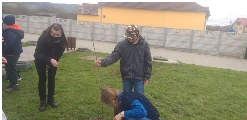
Implicarea părinților și a invitaților